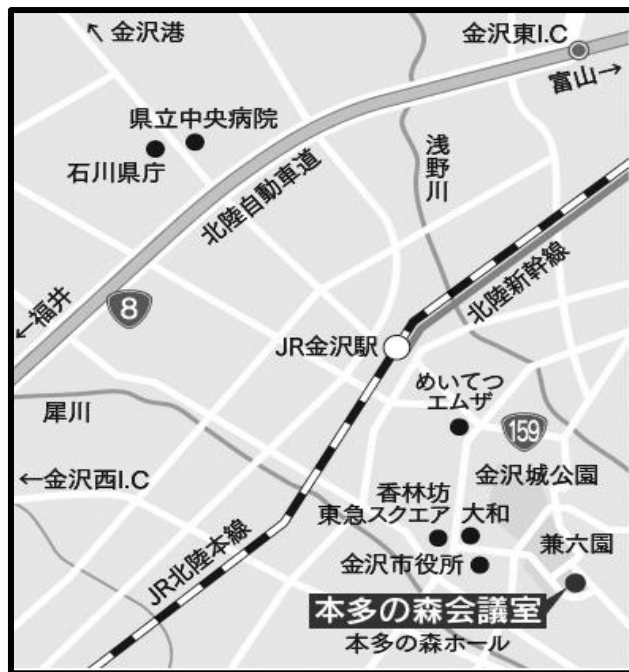
本多の森会議室 (石川県本多の森庁舎内) ※石引駐車場無料割引有