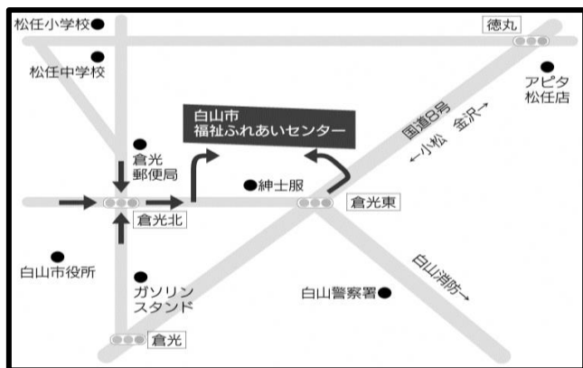
白山市福祉ふれあいセンター ※無料駐車場有