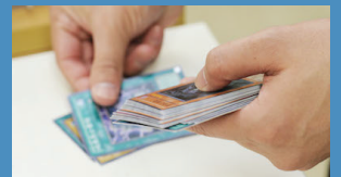
ゲームカードの整理